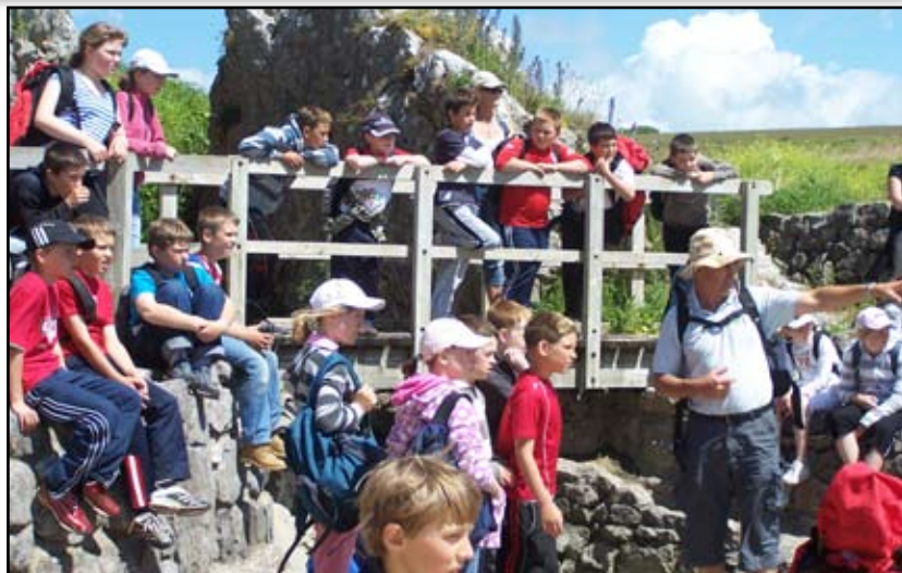
Disgyblion Ysgol Ffynnonbedr ar daith yng Nghanolfan Pentywyn.