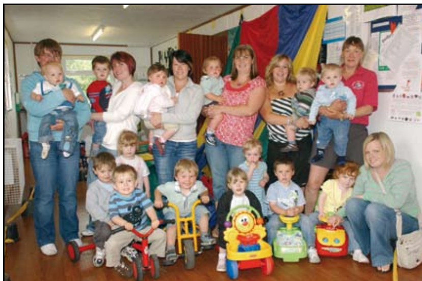
Plant Canolfan Deulu Llanybydder yn codi arian tuag at Child Line drwy bedlo, gyda rhieni a gofalwyr.