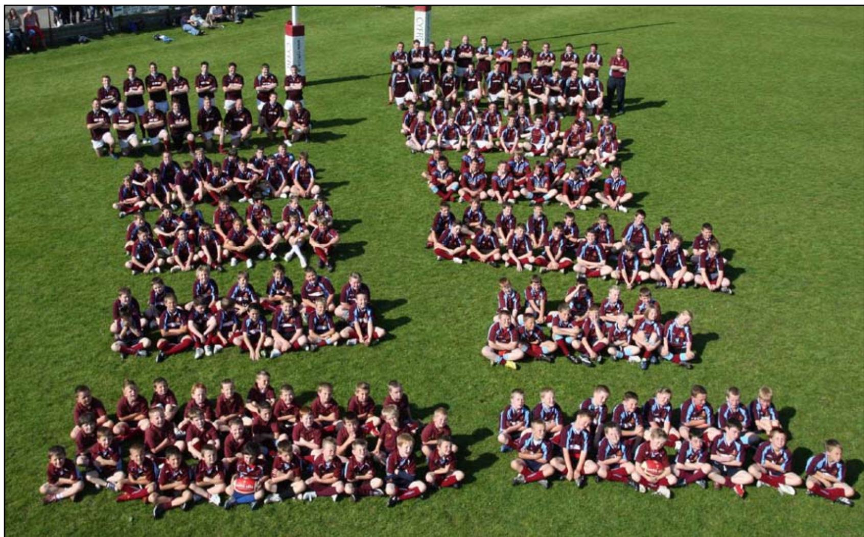
Ar ddiwrnod braf ym mis Mehefin, dyma holl dimoedd rygbi Clwb Rygbi Llambled - pawb yn defnyddio'r un cae i chwarae. Mae rhai o swyddogion y Clwb bellach yn galw am gaeau chwarae ychwanegol.