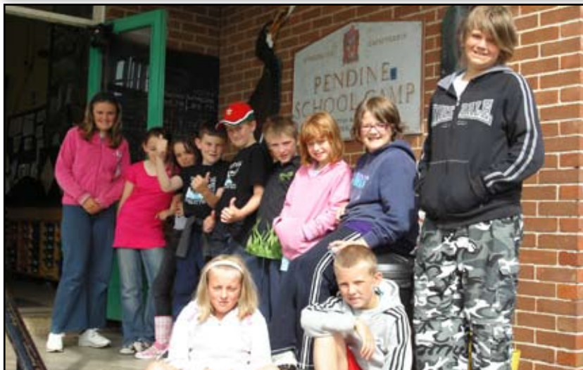
Disgyblion Ysgol Cwrtnewydd yn mwynhau yng Nghanolfan Pentywyn.