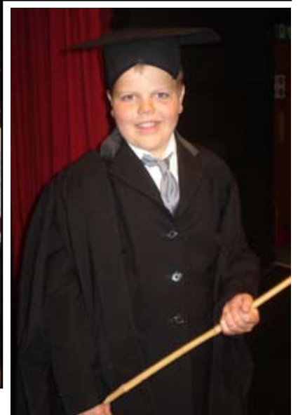
Plant CA1 - adeiladwyr a wnaeth adeiladu'r ysgol