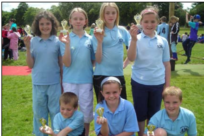
Tîm buddugol Ysgol Llanwnnen yn nhwrmament rownderi yn Ysgol Ffynnonbedr.