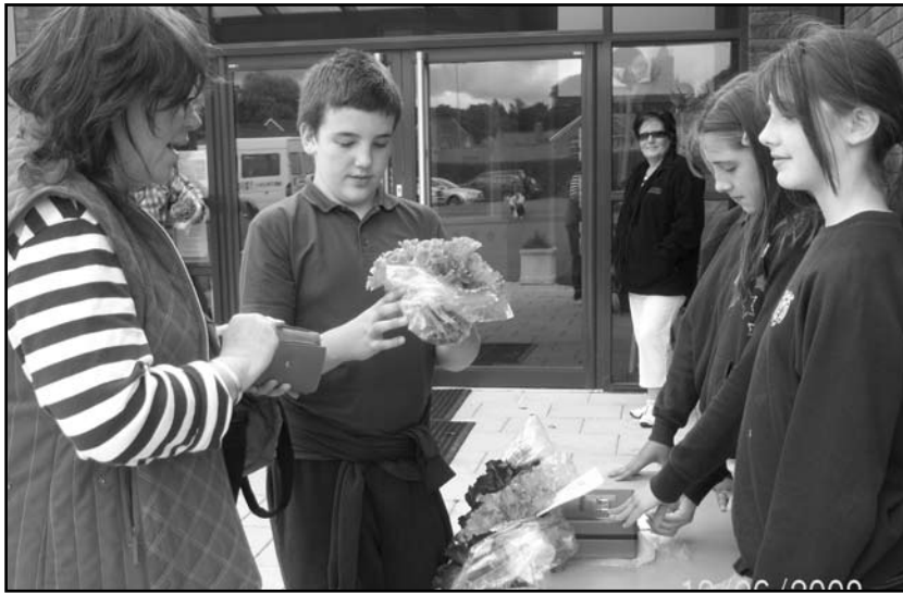
Disgyblion a rhieni Ysgol Ffynnonbedr wrthi'n garddio.