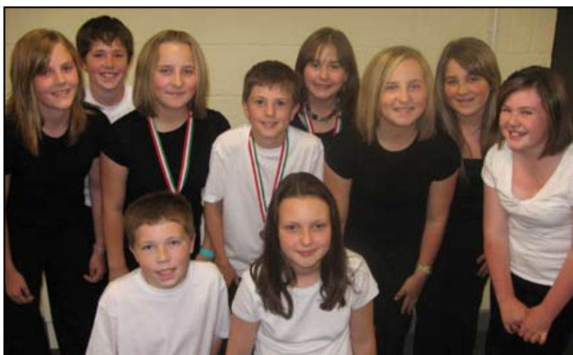
Parti llefaru llwyddiannus Adran Llambed yng Nghyngerdd yr Urdd ym Mhontrhydfendigaid.