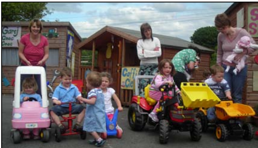
Cylch Ti a Fi Llanwnnen a gychwynnodd y mis diwethaf. Mae croeso cynnes i famau/gofalwyr a'r plantos bach gwrdd yn Ysgol Llanwnnen bob prynhawn ddydd Mercher. Mae'r plant bach yn mwynhau chwarae gyda'r offer gwych sydd tu allan, ac mae digon i'r rhai bach sydd ddim yn cerdded eto i wneud.